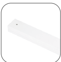
Отверстия под дюбель