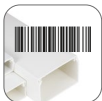
Система штрихкодов – удобство хранения и реализации