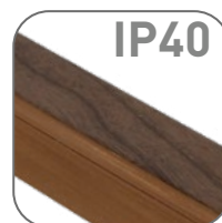
Степень защиты IP40