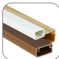
Цвет: белый, светлое дерево, темное дерево