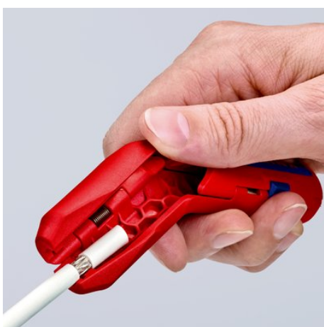
Удаление оболочки с коаксиального кабеля