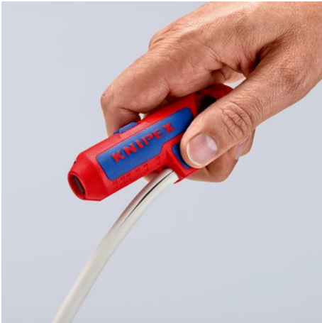
С лезвием для удобного продольного реза, скрытым в выступающем блоке с упором под большой палец