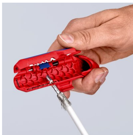
Удаление изоляции с коаксиального кабеля