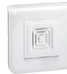
0 782 00

Шинная технология BUS/SCS реализует следующие функции: - вызов (обычный, экстренный, тревожный, из санузла); - подтверждение вызова; - индикация вызовов (звуковая, световая) - передача информации о вызовах во внешние сети - голосовая связь - мониторинг работы системы и архивирование данных - внутренняя связь; - обмен данными с блоком управления медсестры и со всеми элементами системы через шину BUS/SCS; - передачу сигналов на все индикаторы (например, на коридорный индикатор, на придверный блок, ручной блок вызова, коридорный дисплей)