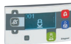
0 766 07