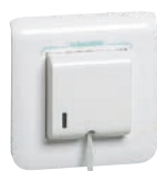
0 782 48