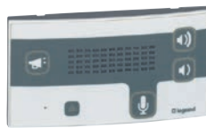
0 766 08