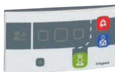
0 766 06