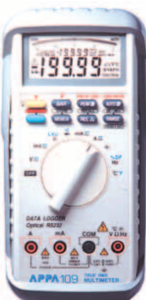
APPA 107N / 109N