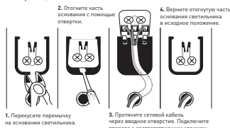
Рис. 1. Схема подключения светильника к сети 230В.

3.3.2. Этот провод необходимо подключить к проводу источника питания с помощью внешнего клемника (в комплект не входит) в соответствии со схемой, изображенной на рис.1;